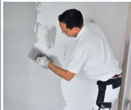
... oder klassisch mit der Kelle ...