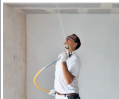
... oder, speziell auf großen Flächen, mit dem Airless-Spritzgerät.