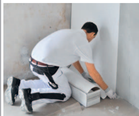
Das Spezialvlies SCHÖNOX aDECO SV kommt direkt aus dem Karton an die Wand.