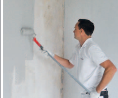
Ergonomischer Auftrag mit der Rolle ...

Nur mit diesem Werkzeug lässt sich das Wandsystem optimal verarbeiten.